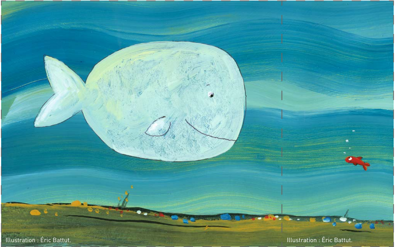
Illustration : Éric Battut.