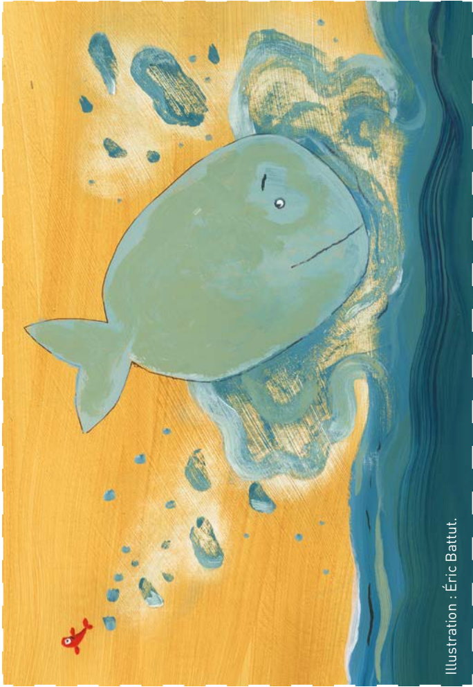
Illustration : Éric Battut.