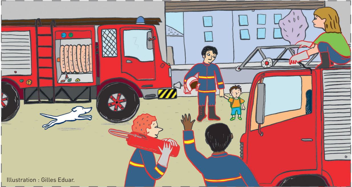
Illustration : Gilles Eduar.