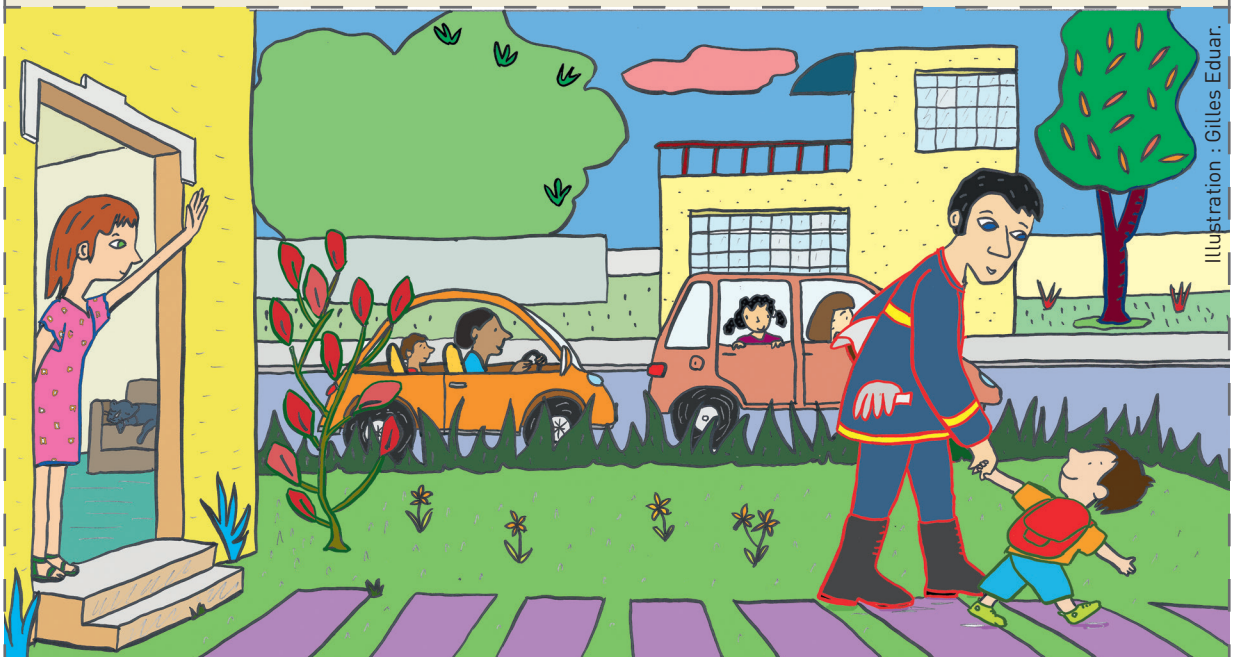
Illustration : Gilles Eduar.