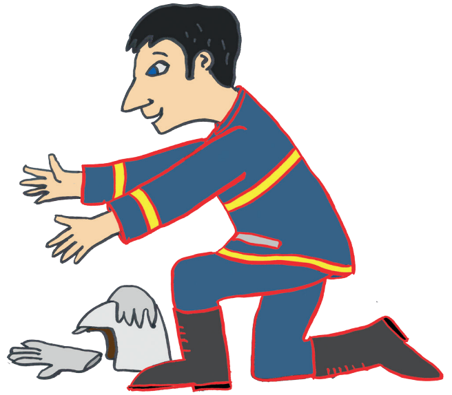
Illustration : Gilles Eduar.