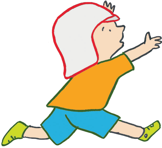
Illustration : Gilles Eduar.