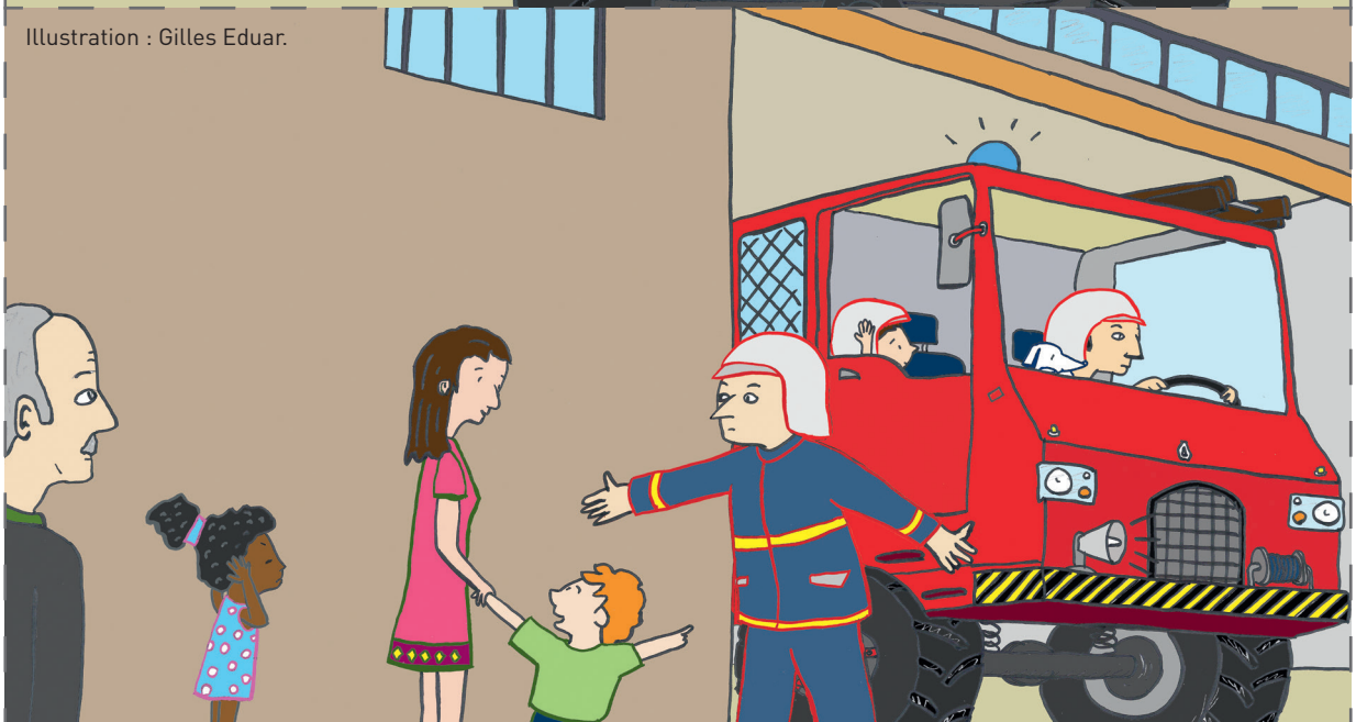
Illustration : Gilles Eduar.