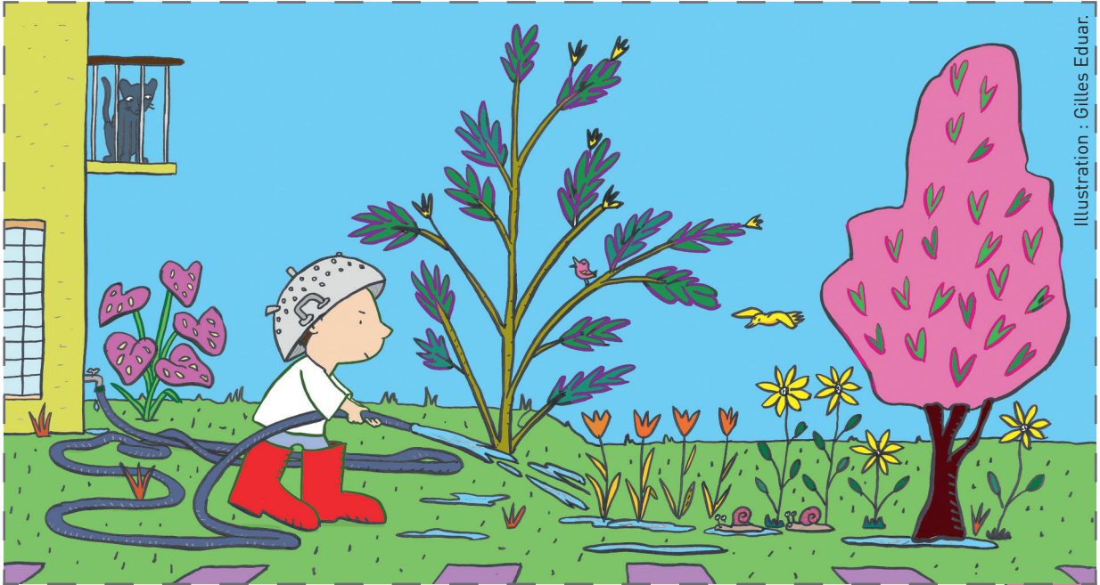
Illustration : Gilles Eduar.