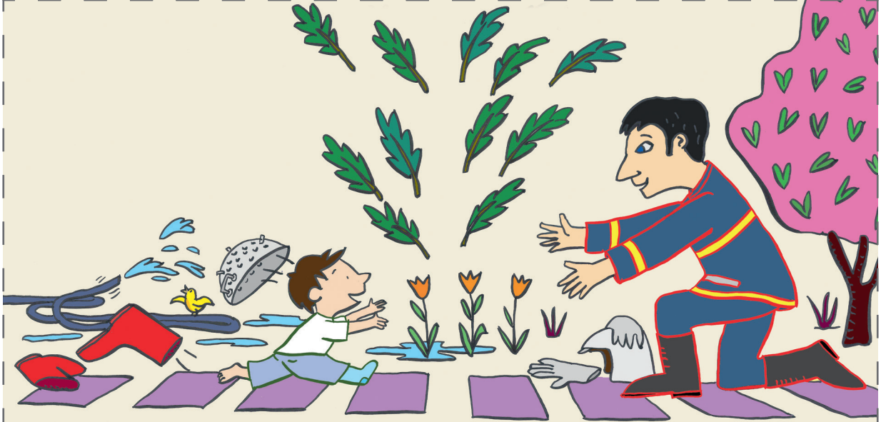
Illustration : Gilles Eduar.