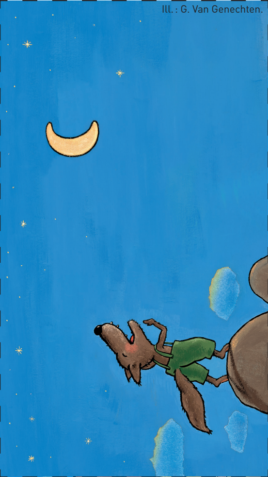
ILL. : G. Van Genechten.