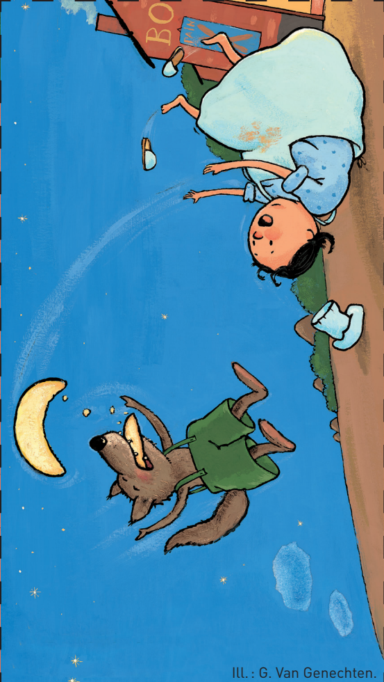
ILL. : G. Van Genechten.