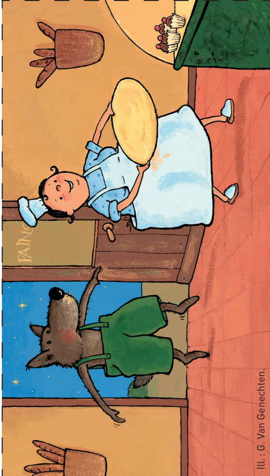
ILL. : G. Van Genechten.