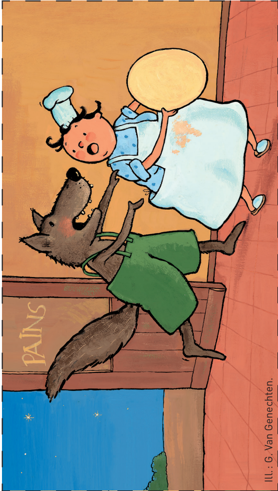
ILL. : G. Van Genechten.