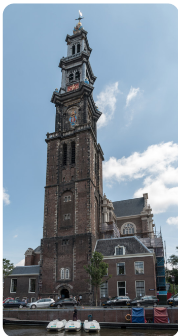
↑ Le clocher de l'église Westerkerk, visible depuis le grenier de l'Annexe. La cloche sonnait toutes les 15 minutes.

↓ Passionnée par le cinéma, Anne découpait les photos des vedettes dans les magazines que Miep lui apportait de temps en temps et les collait sur les murs de sa petite chambre.