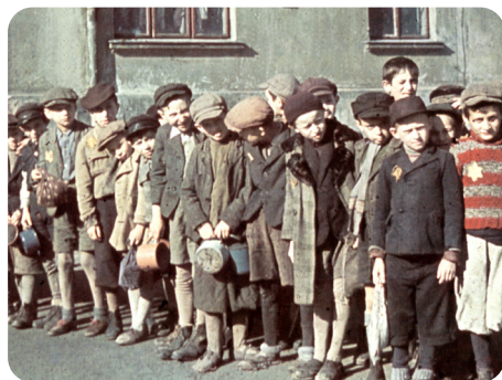
↑ Enfants juifs portant l'étoile jaune, destinée à les distinguer des autres enfants.

En Europe, où domine la religion chrétienne, les Juifs sont souvent victimes de discrimination. Durant des siècles, les prêtres enseignent à leurs fidèles que Jésus-Christ a été tué par des Juifs, et les accusent d'être les ennemis du christianisme. C'est ainsi que des préjugés et de fausses croyances au sujet des Juifs ont pris racine dans l'esprit des chrétiens européens. Les Juifs, qui font partie des peuples minoritaires en Europe, sont longtemps relégués en bas de l'échelle sociale.