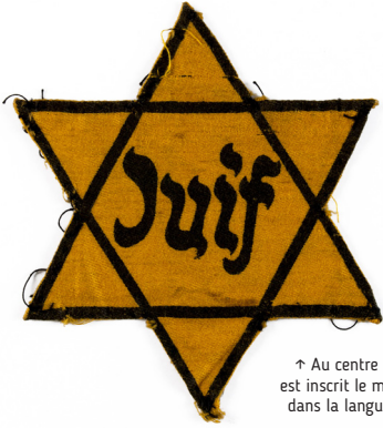
↑ Au centre de l'étoile est inscrit le mot « Juif » dans la langue du pays concerné.