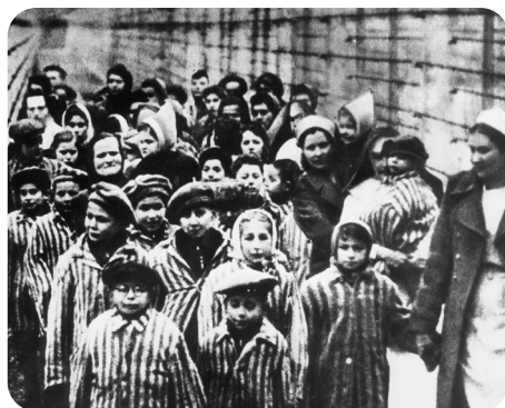
↑ Juifs quittant le camp d'Auschwitz après sa libération.

1. Fascistes : adeptes du fascisme. Le fascisme est une idéologie et un système politique totalitaires, où le parlement n'a aucun pouvoir et où seul un parti politique est autorisé.