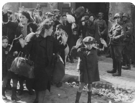
↑ Arrestation de Juifs dans le ghetto de Varsovie.

L'Italie se rend en septembre 1943, puis l'Allemagne en mai 1945, suivie du Japon au mois d'août de la même année.