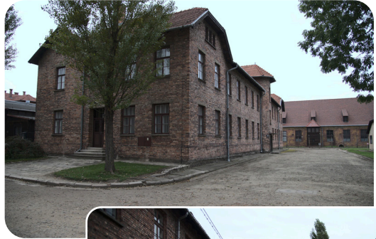
→ Jusqu'à 140 000 personnes ont été enfermées en même temps dans ces bâtiments. Le camp disposait également de laboratoires où les nazis menaient des expériences sur les prisonniers, et de chambres à gaz pour les tuer.

Le camp d'Auschwitz est le plus grand camp de concentration et d'extermination nazi. Les huit habitants de l'Annexe y sont enfermés temporairement. Cerné par des lignes électriques à haute tension, il est impossible de s'en échapper.