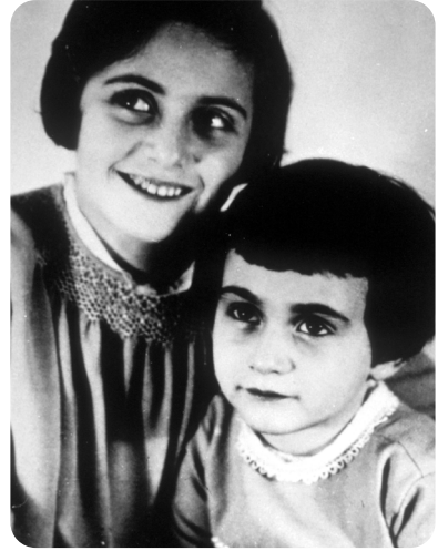
↑ Anne et Margot, sa sœur aînée, en 1930