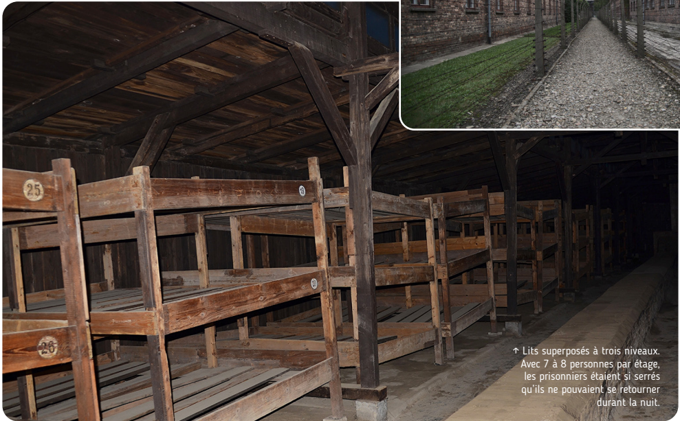
↑ Lits superposés à trois niveaux. Avec 7 à 8 personnes par étage, les prisonniers étaient si serrés qu'ils ne pouvaient se retourner durant la nuit.