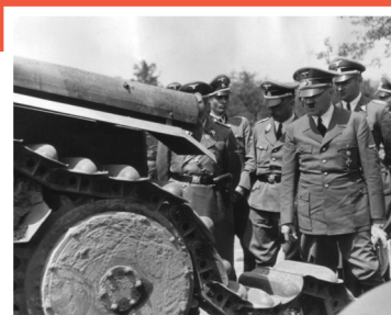
↑ Hitler et ses officiers inspectant un char français détruit au début de la guerre, en 1940.