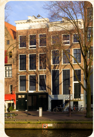
↑ La maison où Anne Frank et sa famille se sont cachés existe toujours à Amsterdam (à gauche sur la photo).