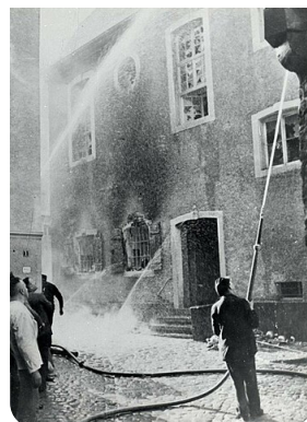
↑ Le lendemain de la Nuit de cristal.

La Nuit de cristal désigne les attaques visant les Juifs qui se produisent à travers toute l'Allemagne au cours de la nuit du 9 novembre 1938. De nombreux commerces et synagogues sont détruits.